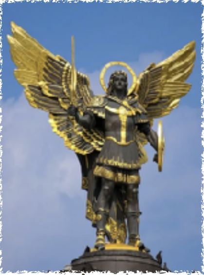
Statue of St. Michael the Archangel that stands above Kyiv's Independence Square. St. Michael is patron saint of the Ukrainian capital.