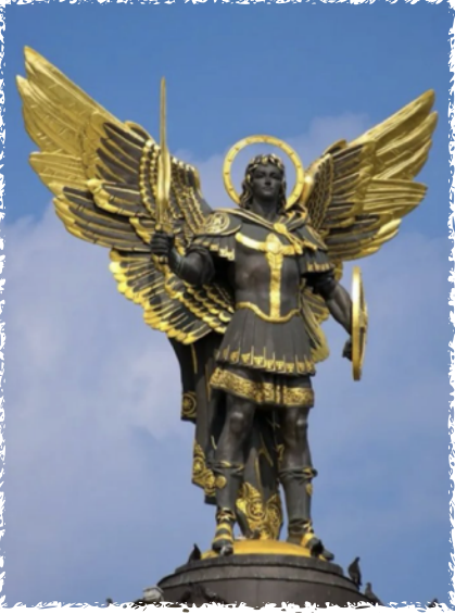
Statue of St. Michael the Archangel that stands above Kyiv's Independence Square. St. Michael is patron saint of the Ukrainian capital.