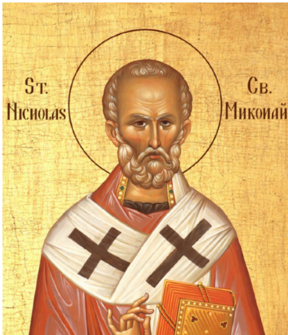
ST. NICHOLAS THE WONDERWORKER