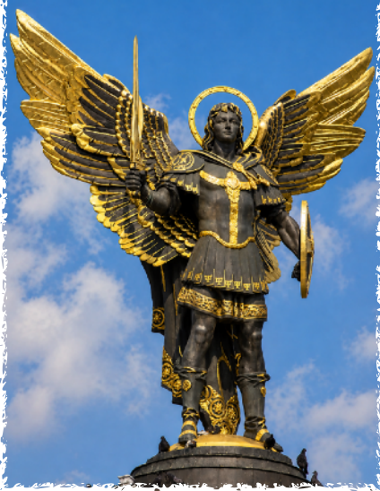
Statue of St. Michael the Archangel that stands above Kyiv's Independence Square. St. Michael is patron saint of the Ukrainian capital.